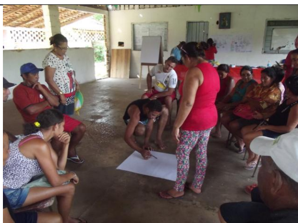
Figura 9: Elaboração do mapa da comunidade pelos moradores do PAE Ilha de Santana