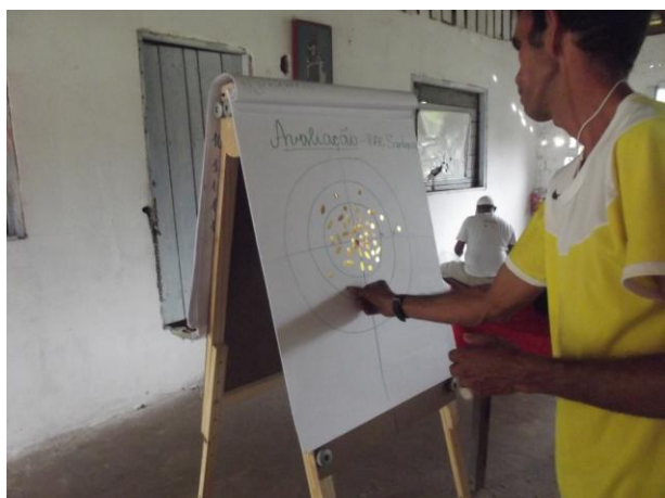
Figura 13: Avaliação participativa do DRP realizado no PAE Ilha de Santana