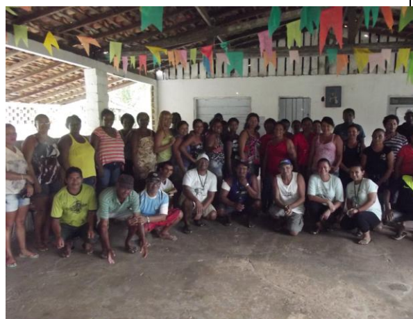
Figura 14: Momento final do DRP do PAE Ilha de Santana.