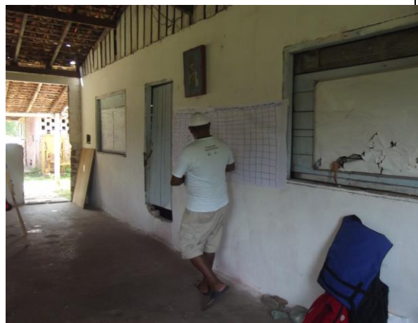
Figura 12: Elaboração do Calendário Agrícola do PAE Ilha de Santana