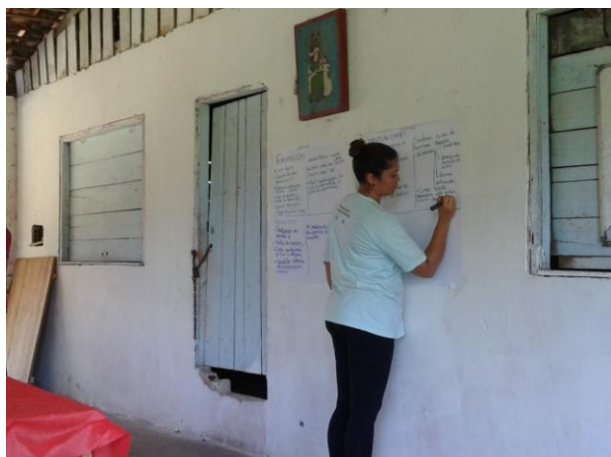
Figura 7: Elaboração da Matriz FOFA durante o DRP do PAE Ilha de Santana