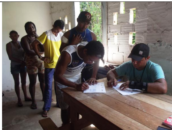
Figura 2: Assinatura do ateste coletivo do DRP no PAE Ilha de Santana