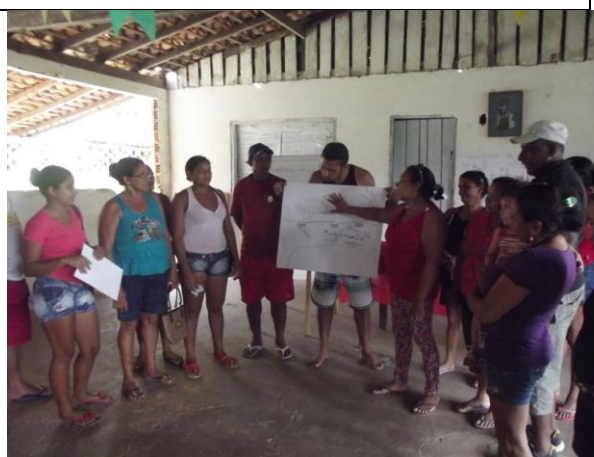
Figura 10: Exposição do mapa feito pelos comunitários.