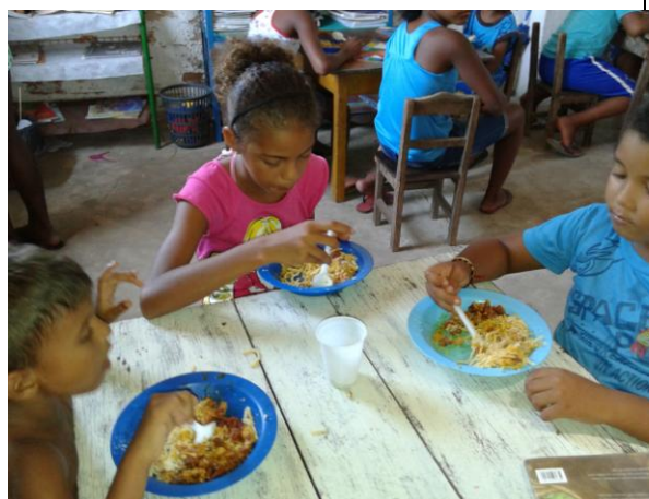
Figura 8: Almoço oferecido às crianças durante o DRP do PAE Ilha de Santana