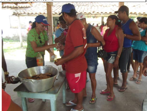
Figura 4: Lanche servido no período da manhã durante o DRP do PAE Ilha de Santana