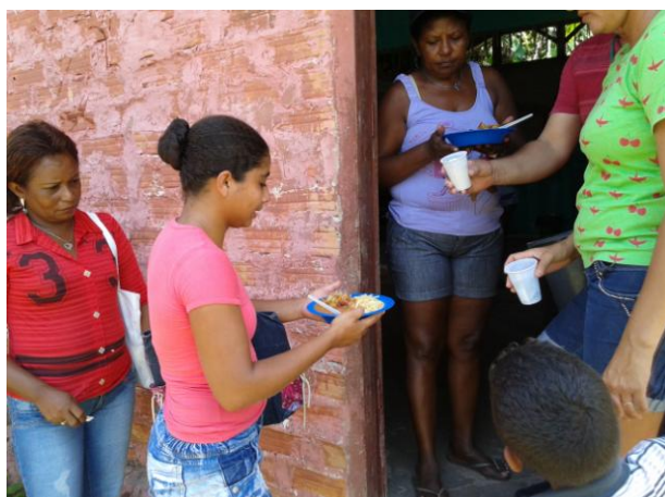
Figura 7: Almoço oferecido aos adultos durante o DRP do PAE Ilha de Santana