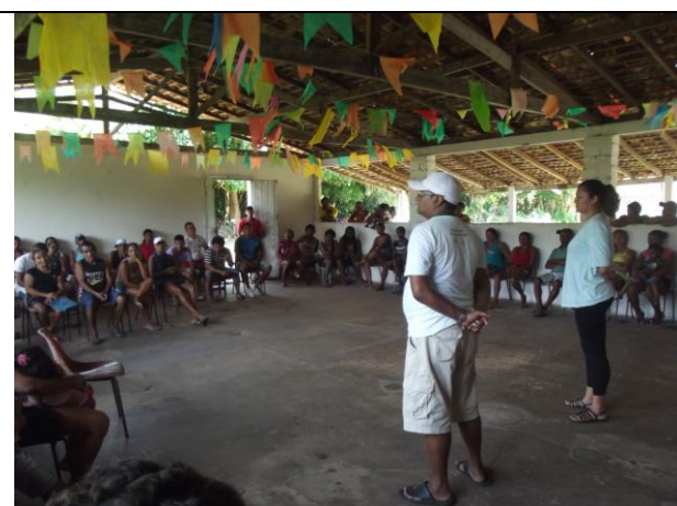
Figura 5: Levantamento das organizações sociais presentes no PAE Ilha de Santana