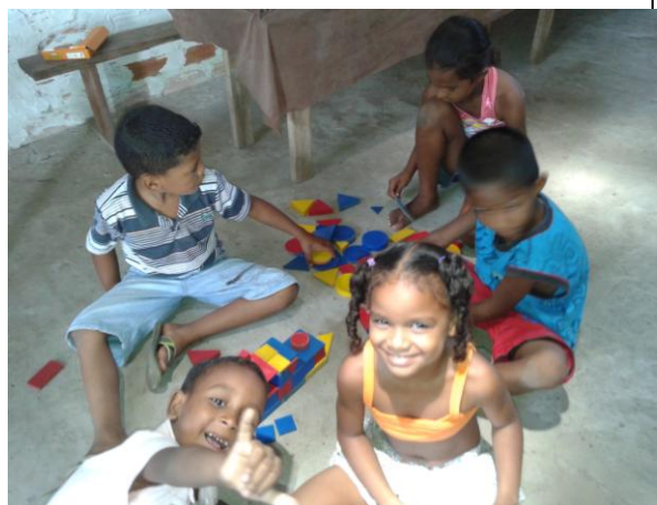
Figura 8: Espaço das crianças