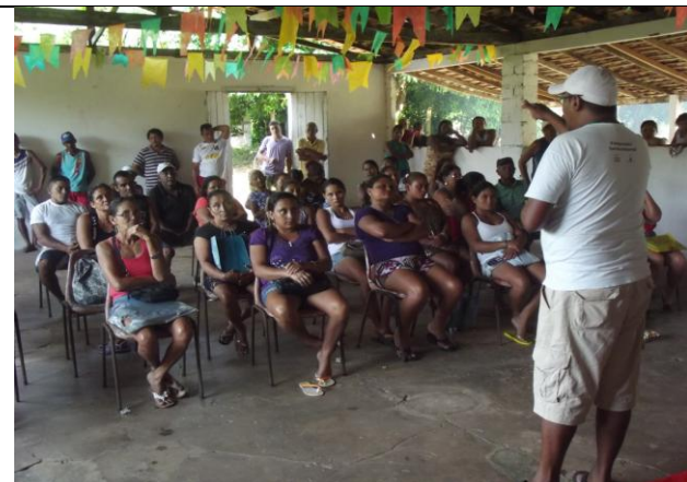
Figura 1: Apresentação do DRP no PAE Ilha de Santana