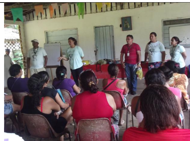
Figura 3: Apresentação da equipe técnica do projeto ATER.