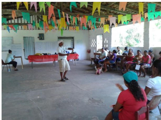
Figura 11: Elaboração do Calendário Agrícola do PAE Ilha de Santana