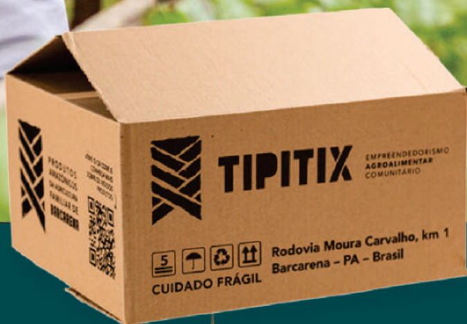
CAIXA 02 30x26x15cm