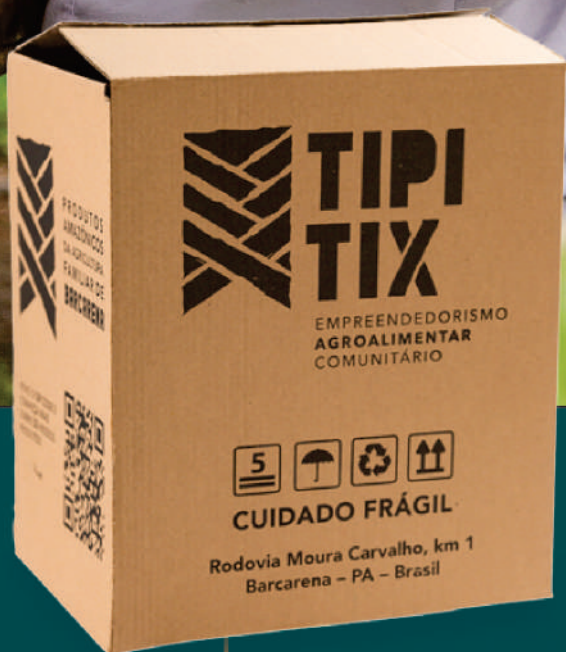
CAIXA 01 30x22x35cm